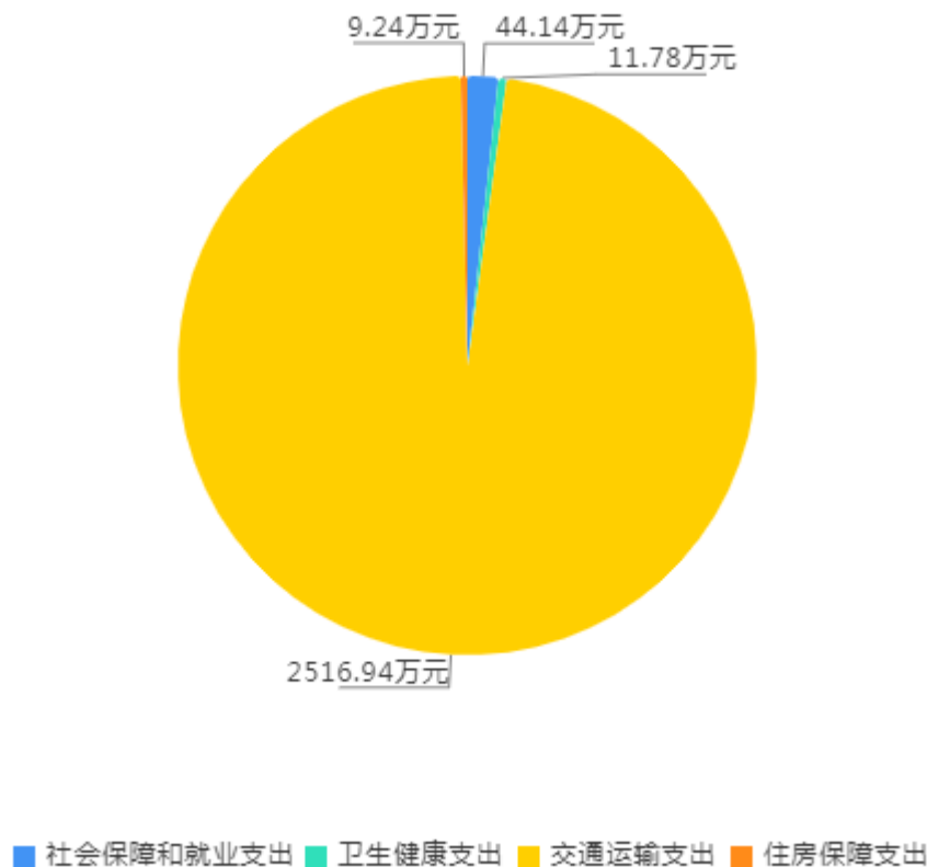
2024年财政拨款预算支出构成