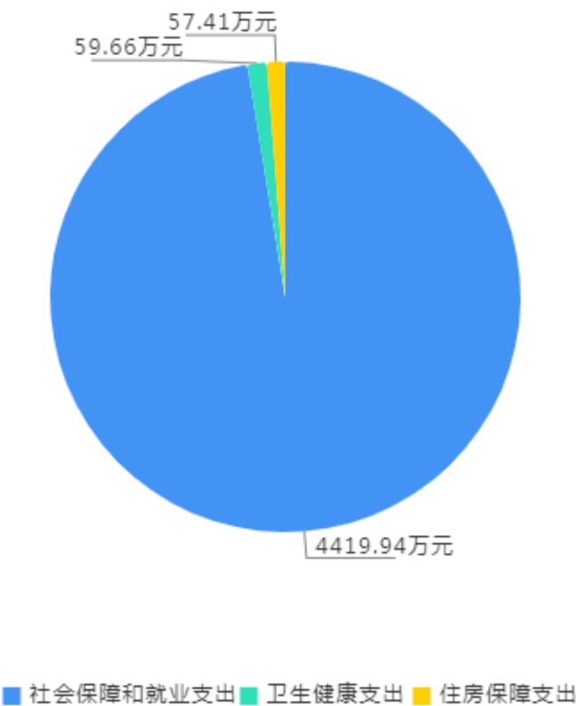
2024年财政拨款预算支出构成

1、社会保障和就业支出（类）人力资源和社会保障管理事务（款）行政运行（项）2024年预算数为737.95万元，比上年增加36.96万元，增长5.27%。主要是2023年新考入5名公务员和缴纳社会保险基数增长。