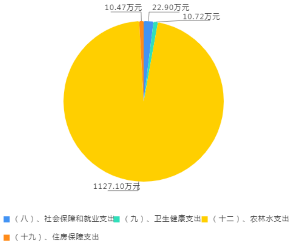
2024年财政拨款预算支出