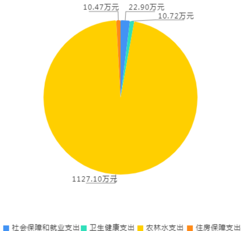
2024年财政拨款预算支出构成