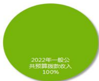
2022年部门收入预算情况

中共西宁市湟中区委宣传部 2022 年收入预算 411.24 万元，其中：上年结转 0 万元；一般公共预算拨款收入 411.24 万元，占 100%。